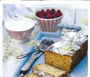
Gutes mit Holunder Ob Sirup, Essig oder Kuchen: Diese Blüten veredeln alles