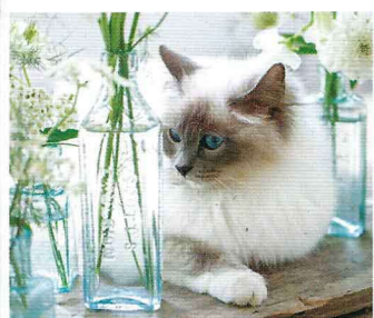
Geliebte Birma-Katze Diese Rasse ist nicht nur sehr schön, sie hat auch Charakter