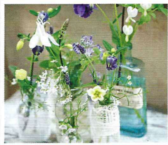
Einfach zauberhaft Süße Deko und Rezepte für ein spontanes Sommerfest